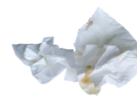
Essuie-tout et serviettes en papier blanc