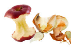
Fruits, légumes et petits déchets verts