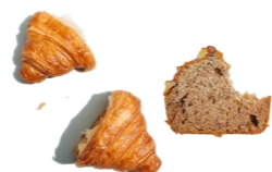
Pains, pâtisseries et céréales