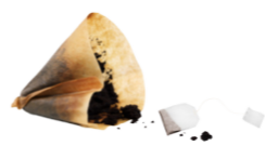
Marc de café et sachets de thé