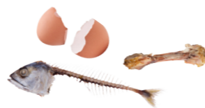
Restes de repas (os, viande, poissons, riz, pâtes, oeufs etc.)