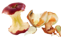
Fruits, légumes et petits déchets verts