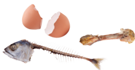
Restes de repas (os, viande, poissons, riz, pâtes, oeufs etc.)