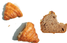
Pains, pâtisseries et céréales