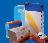
Boîtes et emballages carton