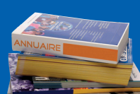
Annuaire et catalogues