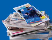
Journaux et magazines