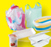
Tous les emballages en plastiques