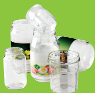
Pots et bocaux en verre