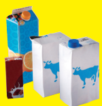
Briques en carton